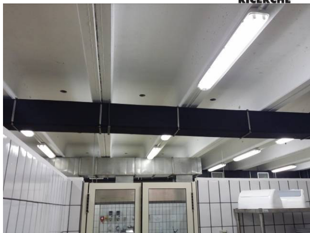
Figura 14 - Particolare impianti ricircolo aria / luci