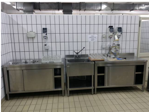
Figura 5 - Zona Piatti freddi