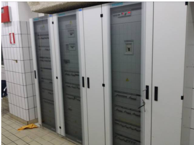
Figura 1 - Locale Quadri Elettrici

La presente documentazione fotografica illustra lo stato attuale dei luoghi della cucina di Sardegna Ricerche e si è conseguita a seguito di diversi sopralluoghi eseguiti in fase di progettazione. Le didascalie fanno riferimento alla attuale disposizione delle zone funzionali.