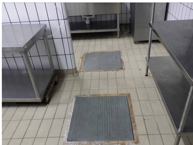
Figura 15 - Pozzetti impianto fognario