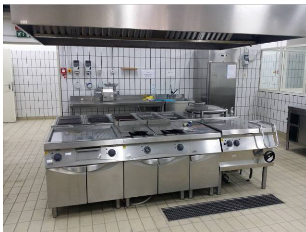
Figura 4 - Zona cottura