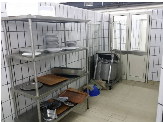
Figura 9 - Zona deposito piatti puliti