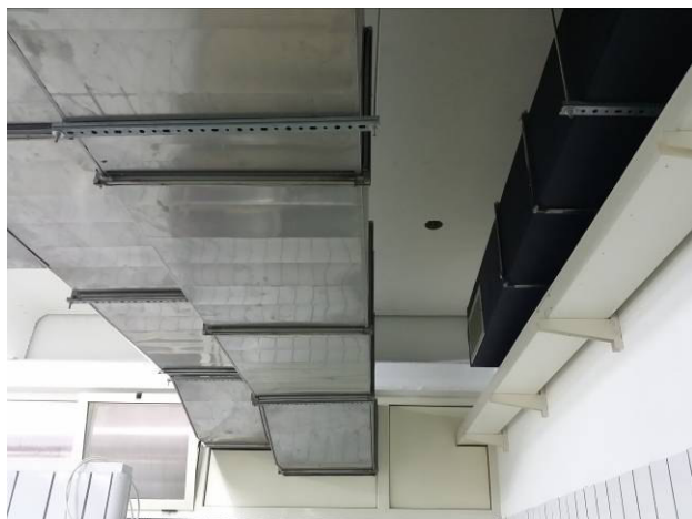
Figura 13 - Presa aspirazione aria