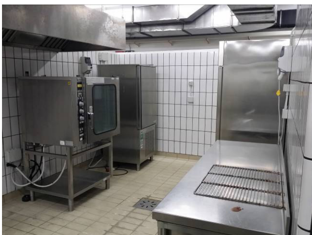
Figura 3 - Zona Forni/abbattimento