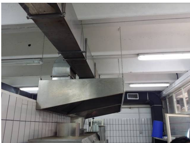
Figura 11 - Cappa aspirazione lavastoviglie