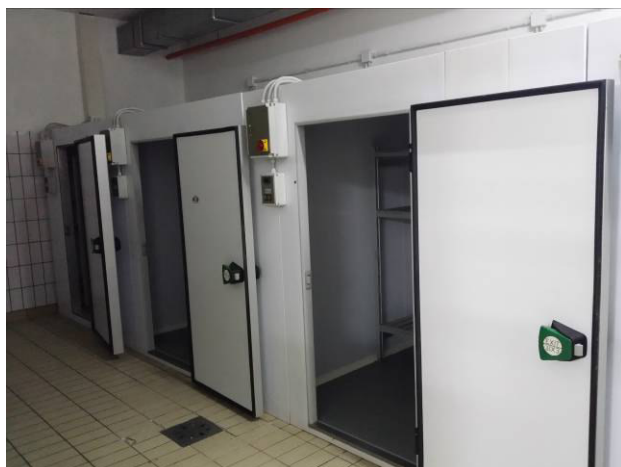
Figura 10 - Particolare celle frigorifere