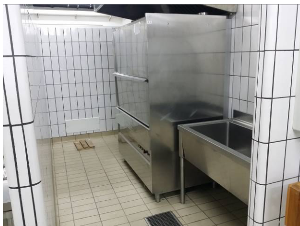
Figura 2 - Locale lavaggio pentole