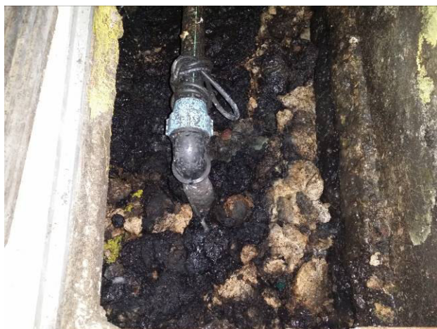
Figura 16 - Pozzetto sollevamento fognario