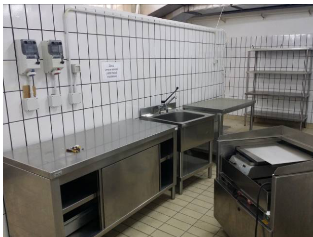
Figura 6 - Preparazione carne/pesce