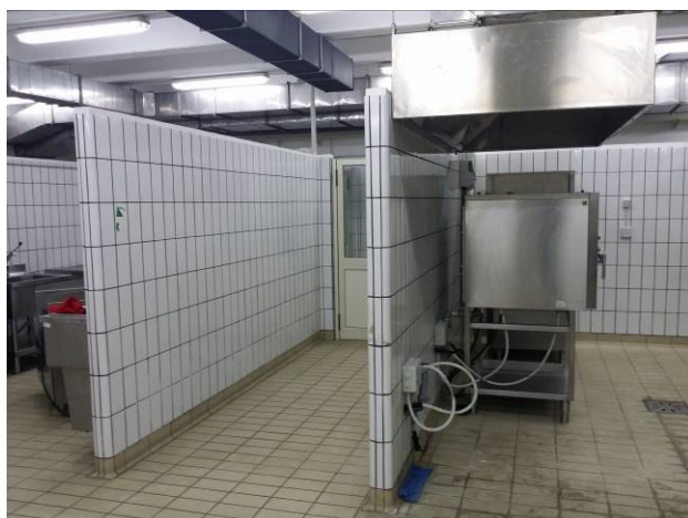
Figura 12 - Cappa aspirazione forni