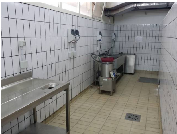
Figura 7 - Zona preparazione verdure