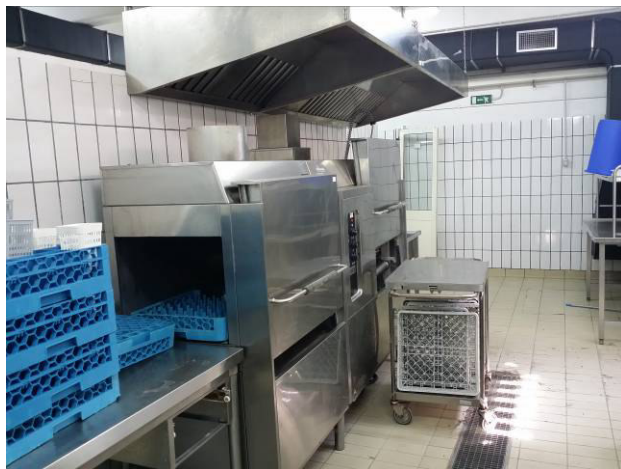
Figura 8 - Lavaggio stoviglie