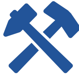
Ambiente Editore ( Authoring Environment )