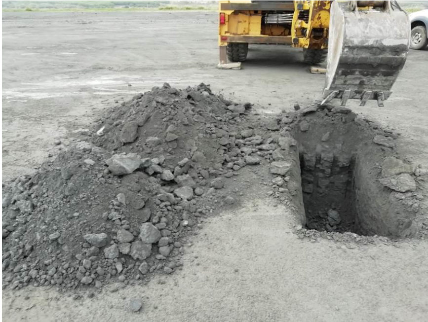
Immagine 3 - Prelievo di materiali per esperimenti di carbonatazione e riuso (Cortoghiana - Carbosulcis)