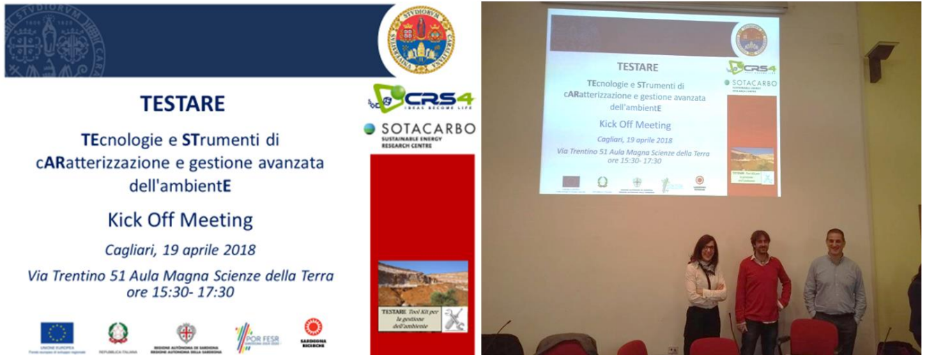
Immagine 1 Copertina evento e rappresentanti del comitato scientifico

Immagini del Kick Off meeting (Immagine 1) e delle attività dimostrative (Immagine da 2 a 6).