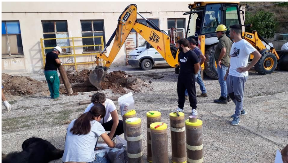
Immagine 2 - Prelievo di campioni per esperimenti di decontaminazione (Masua – IGEA spa)