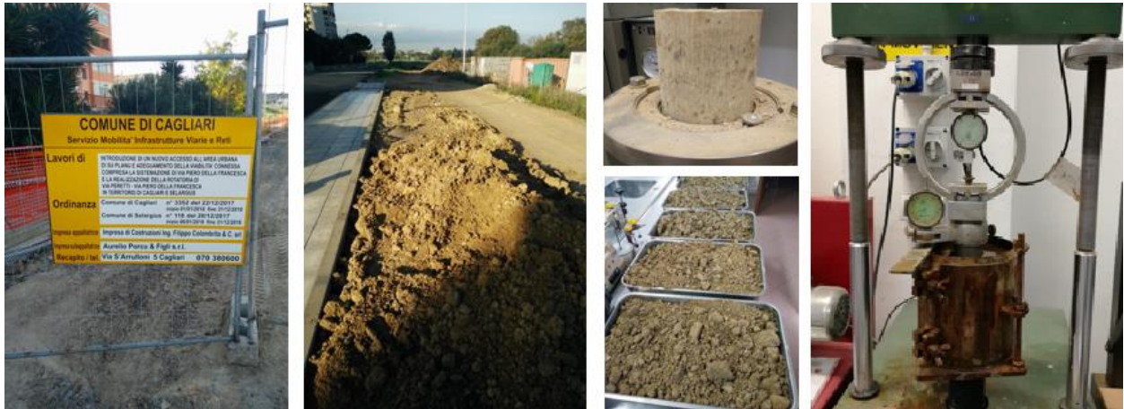
Figura 5. Proprietà meccaniche dei materiali da costruzione TESTARE.